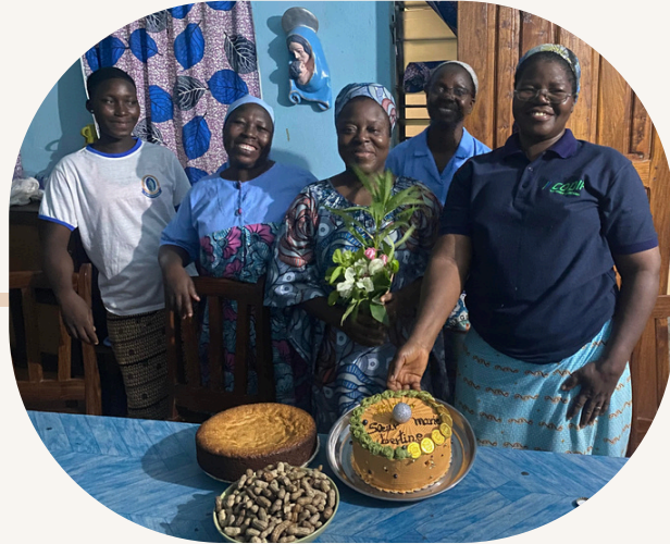
DE LA BONNE HUMEUR DU LEVER JUSQU'AU COUCHER