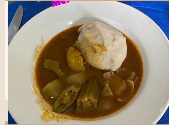
LEUR FAIRE DE BONS PLATS