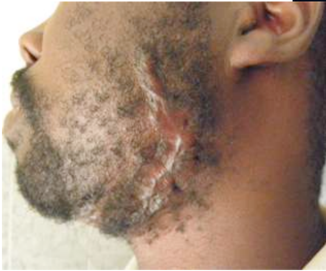
Ci-contre situation le 14 février 2020