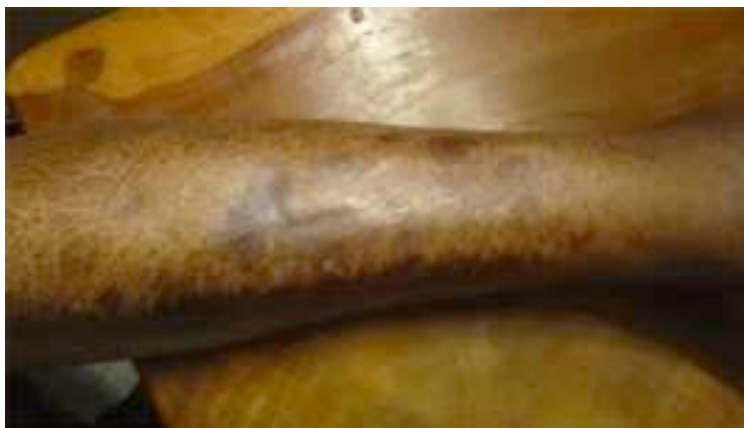
... et le 3 février 2020