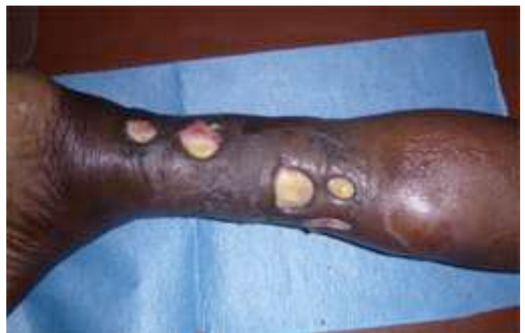
Évolution entre le 5 août 2019.....

Cette constatation a pu être faite à la vue des photos successives de plaies traitées. De plus, au cours de notre mission, nous avons eu l'opportunité de constater la guérison d'une plaie infectée suite à un érysipèle