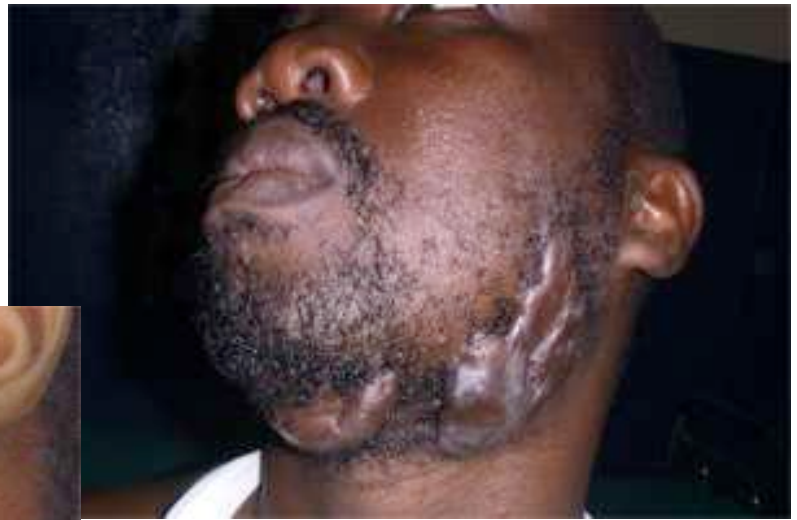
Ci-dessus situation le 23 avril 2019

Ce patient a bénéficié de l'accord passé par le CMS Saint-Luc et les chirurgiens plasticiens en mission à l'hôpital d'Afagnan. Comme convenu, le patient a été revu au CMS et a eu des injections de Kénacort en post opératoire.