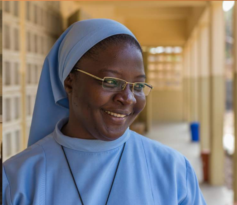
Directrice de l'orphelinat