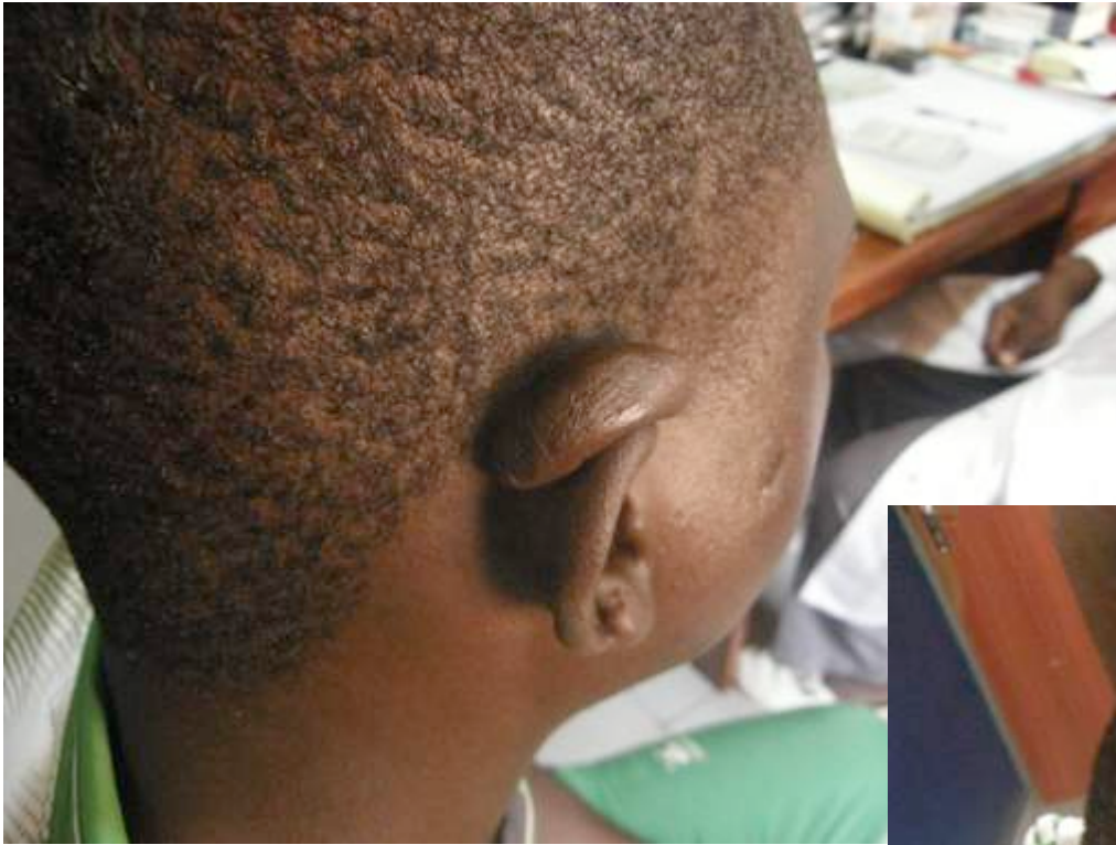
Chéloïde pédiculée au dessus de l'oreille

Programmée pour exérèse suture du pédicule