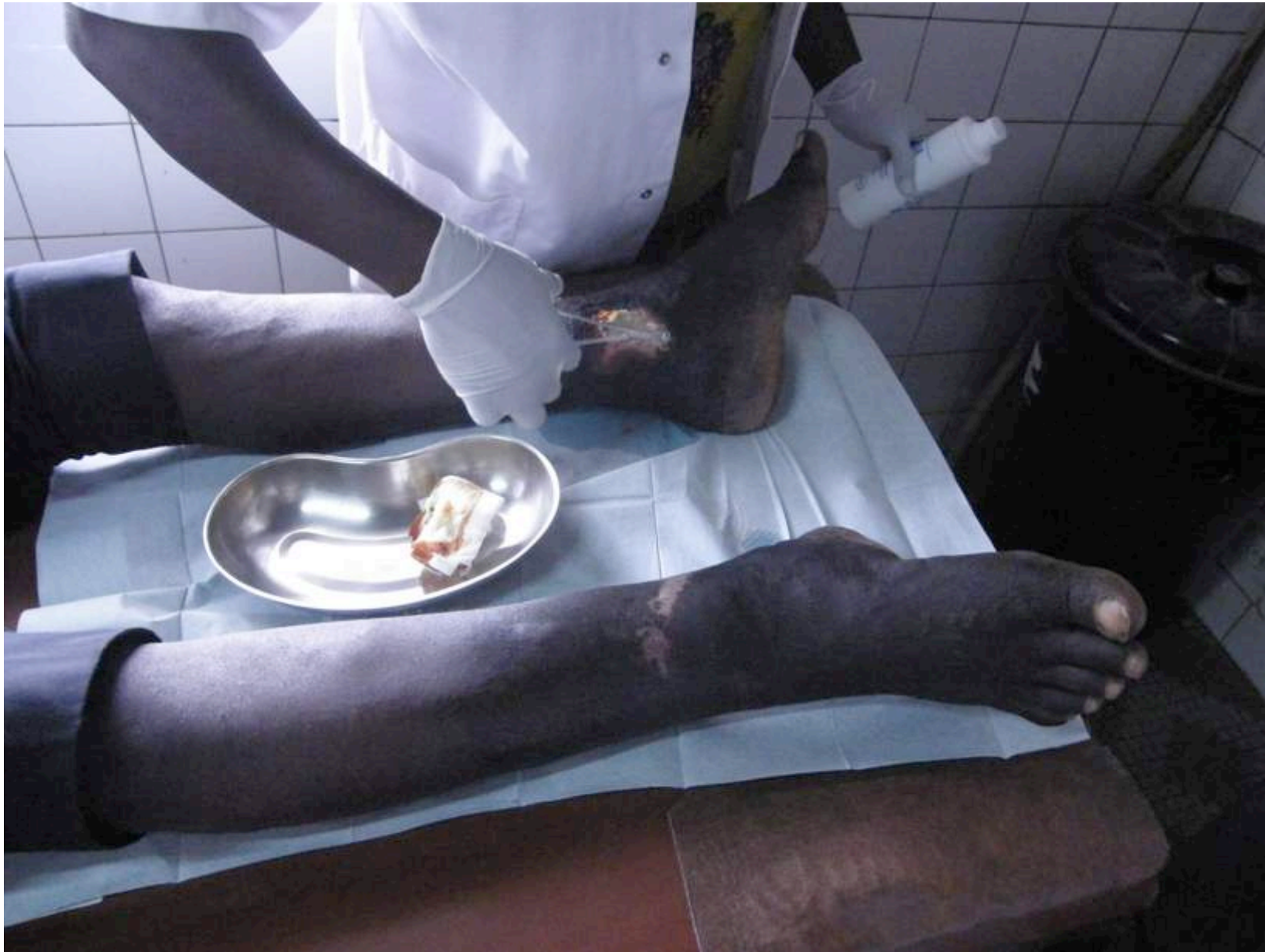
Pansement d' ulcère malléolaire interne Gauche sur lymphoedème chronique traité depuis 3 jours par PYOSTACINE en raison d'une surinfection