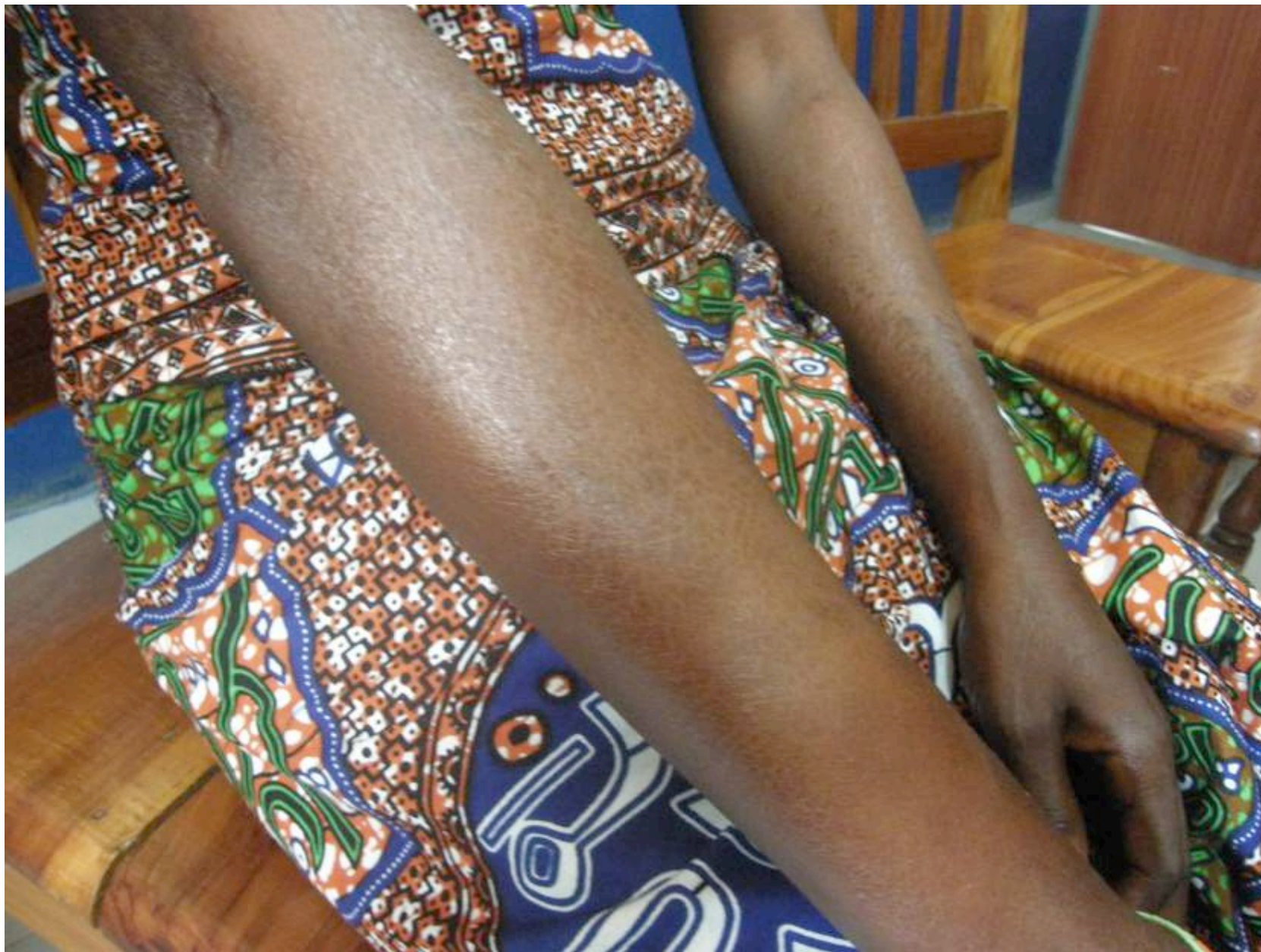
Eczéma ichtyosiforme des avant bras chez une coiffeuse faisant suspecter une allergie de contact aux produits de coiffure