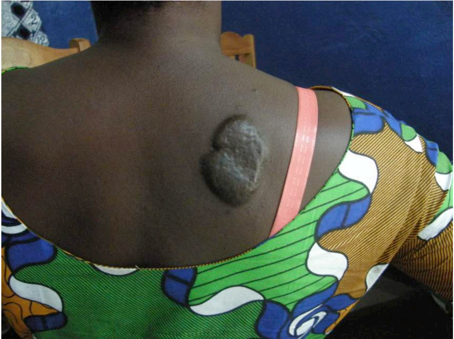
Cicatrice chéloïde : plaque dorsale