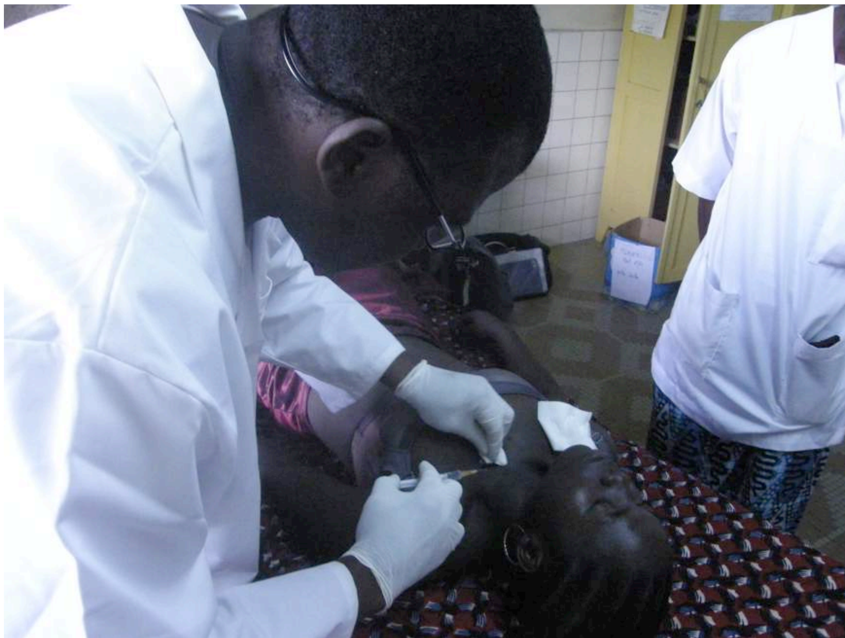
Anesthésie locale par infiltration de xylocaïne 1% sans adrénaline avant injection par dermojet