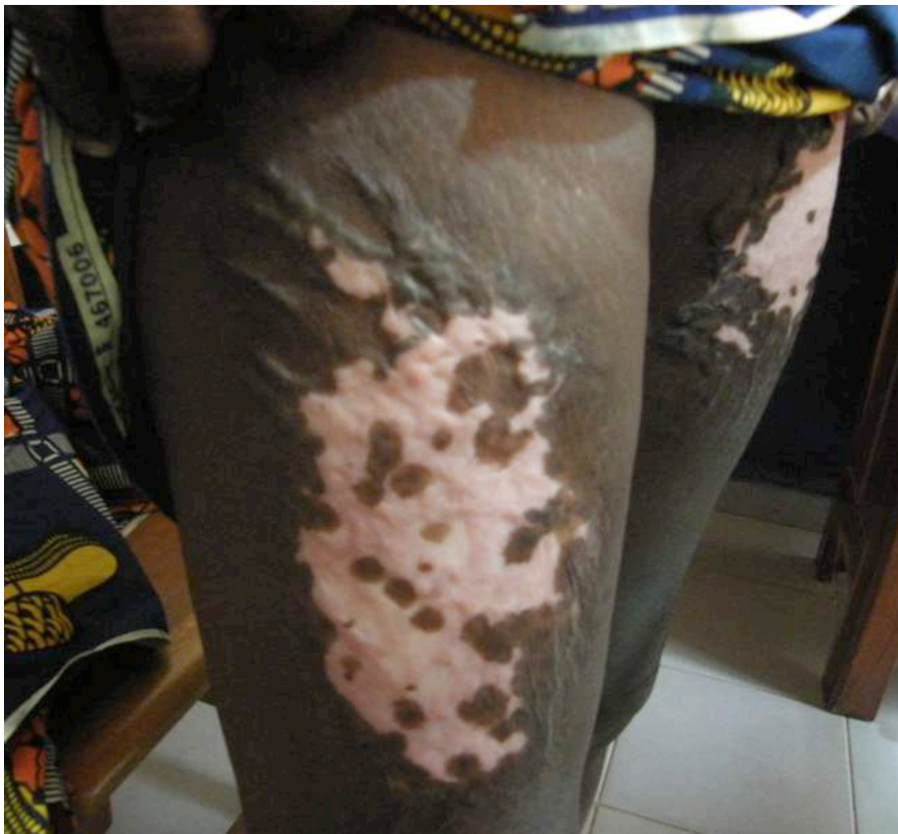
Placards cicatriciels dépigmentés anciens chez une dame âgée. Cicatrices de brûlures ne relevant pas du KENACORT mais prescription de DERMOVAL crème en raison d'un prurit séquellaire