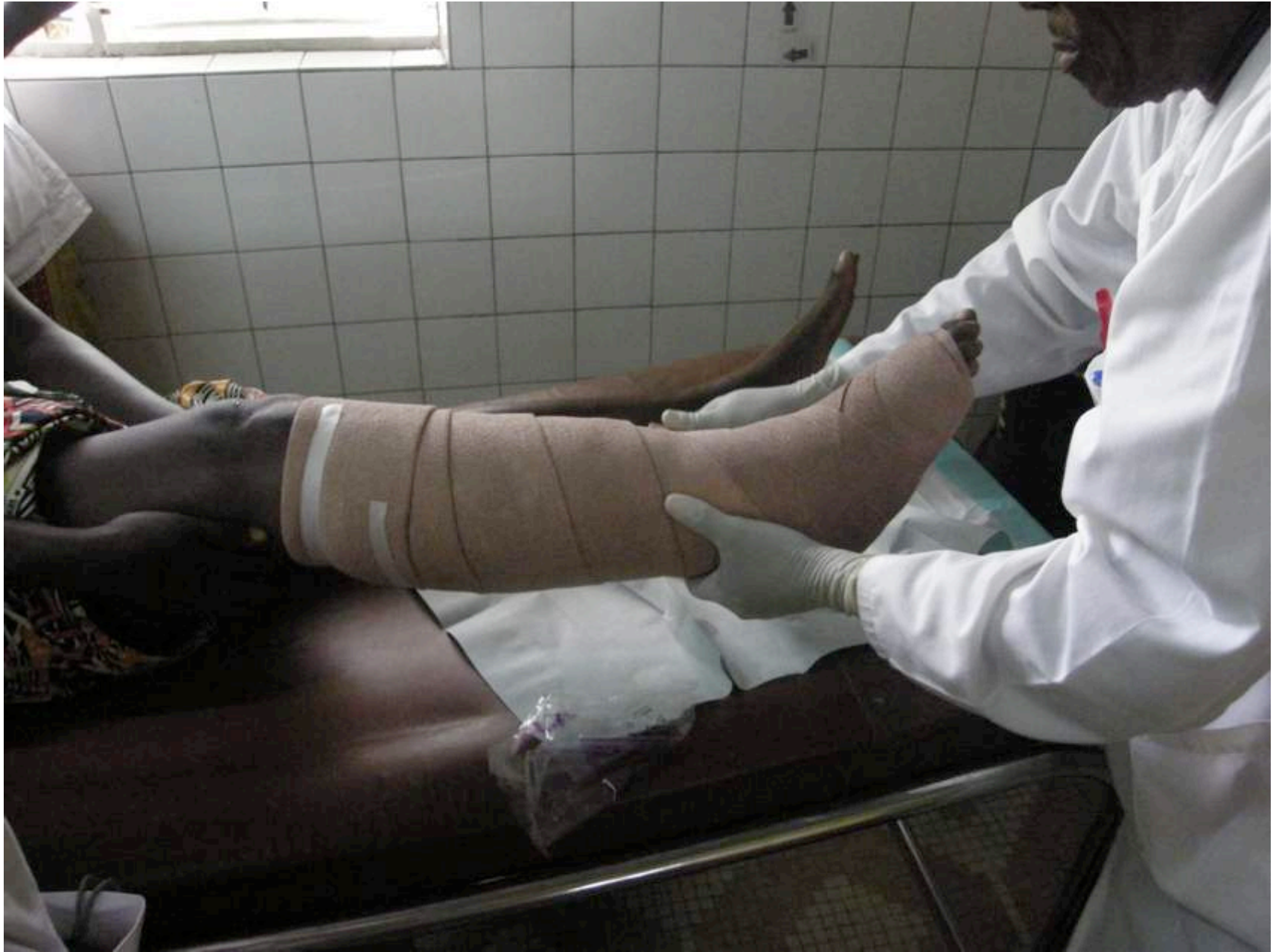
Jambe de Caroline : Pose d'un bandage multicouches compressif avec COHEBAN