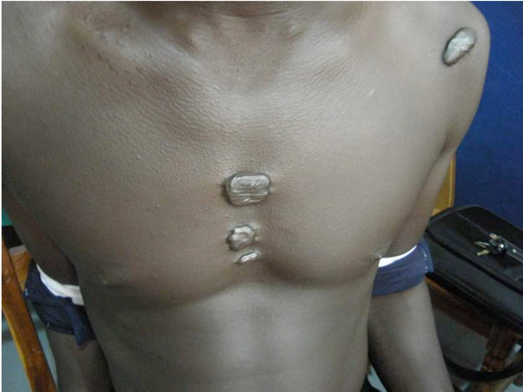
Cicatrices chéloïdes : sternum et épaule gauche