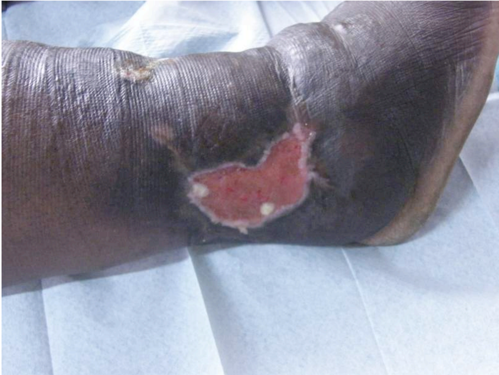
Jambe de Caroline : réfection du pansement sur ulcération malléolaire résiduelle