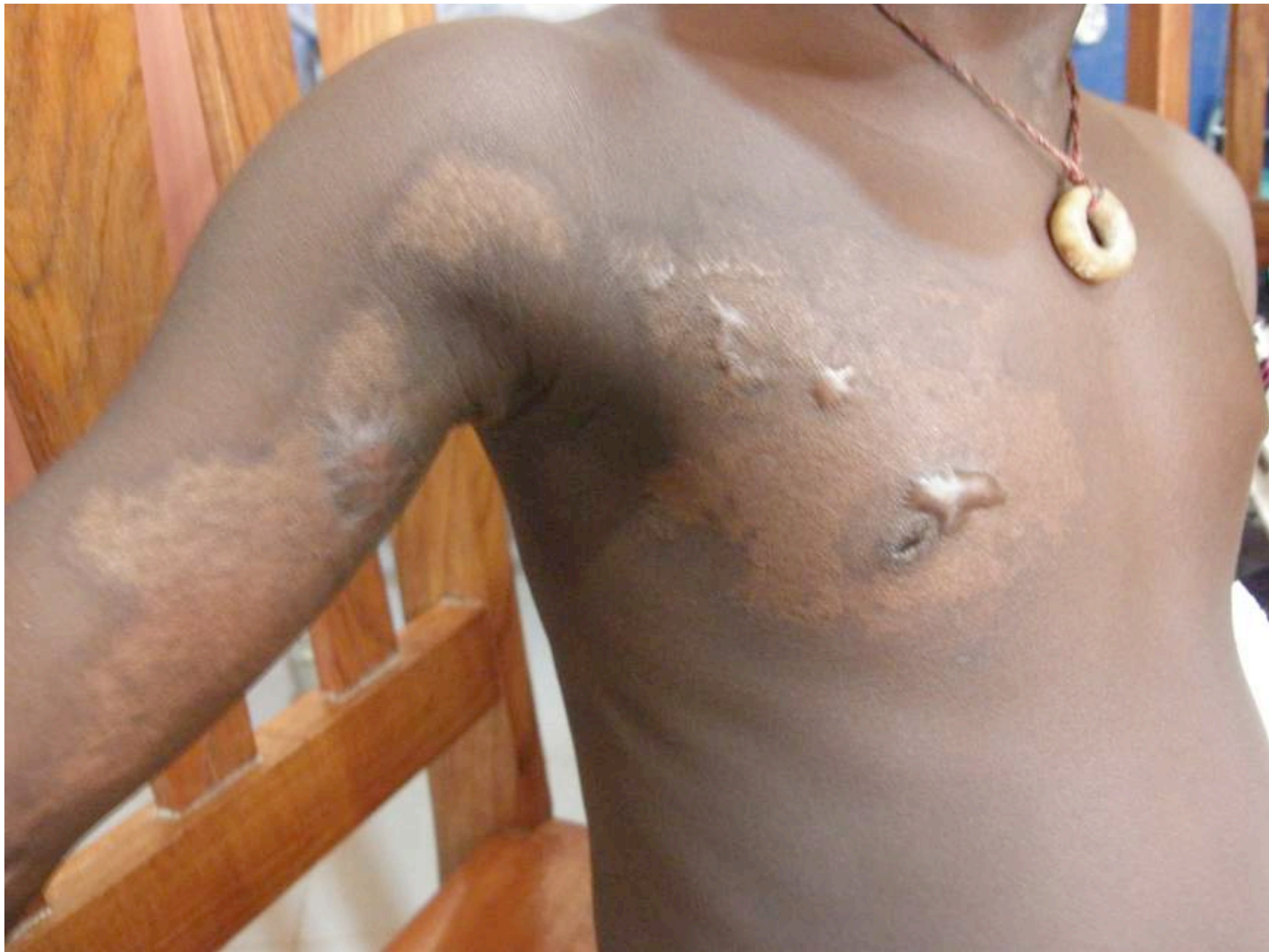
Fillette de 6 ans Cicatrice de brûlure par eau bouillante sur le tronc et le bras