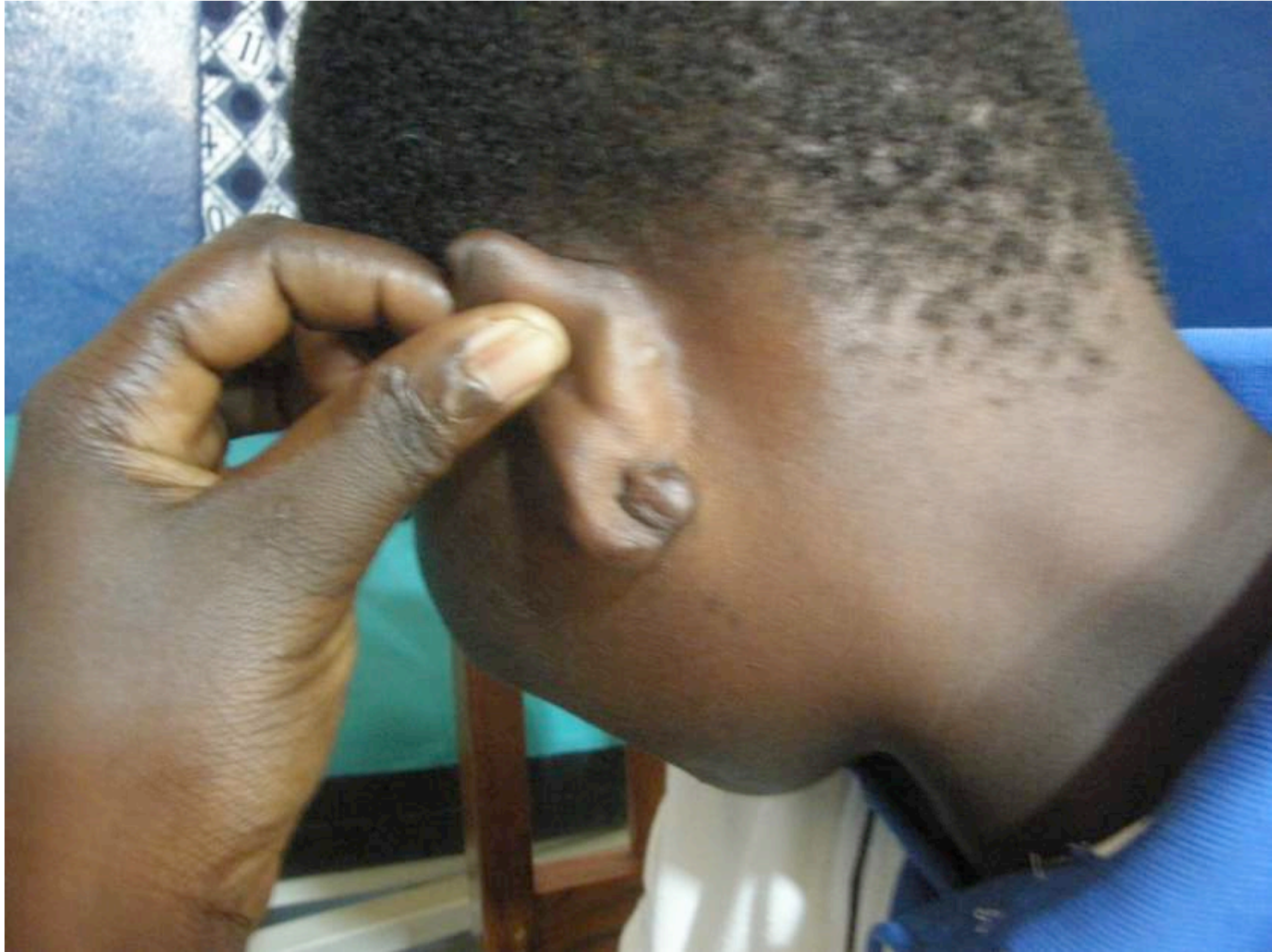
Cicatrice chéloïde : Nodule de lobe auriculaire