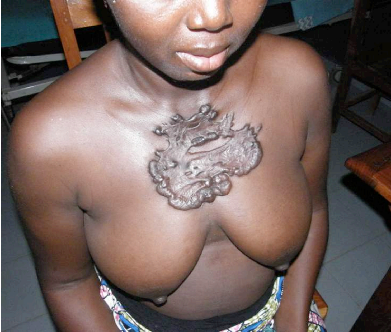
Cicatrice chéloïde pré sternale