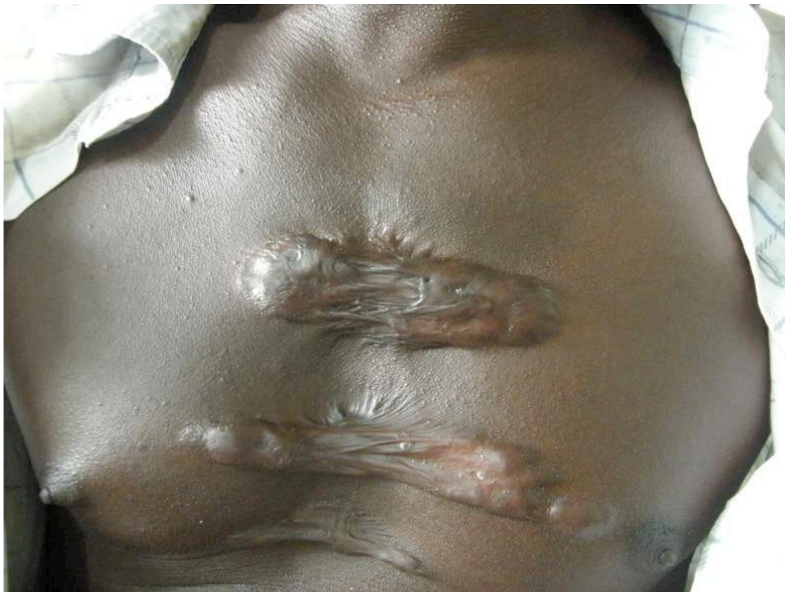
Cicatrice chéloïde pré sternale