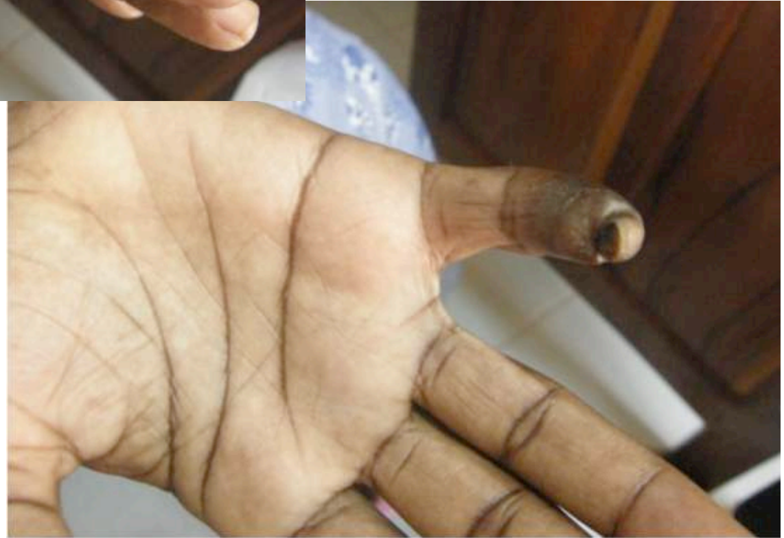
Cicatrice digitale avec atrophie de la phalange distale post panaris